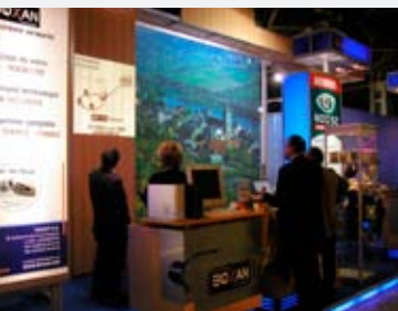
19 - 21 octobre 2005: Le salon « Initiatives » à Liège place le secteur des services au centre de tous les intérêts. La société Tipsoft, un des 12 exposants luxembourgeois, présente ses produits aux clients