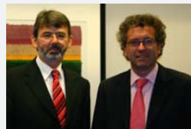
11 novembre 2005: La Chambre de Commerce rencontre le rapporteur du budget de l'Etat, Roger Negri (à g.), dans le cadre du Budget de l'Etat 2006

En septembre 2005, le centre d'études prospectives CEPROS a présenté sa nouvelle étude intitulée « Le système de santé de la Grande Région 2020 » dans le cadre d'une conférence de presse en présence du Ministre de la Santé. L'étude visait à contribuer au développement d'une vision commune et à long terme des soins de santé en milieu hospitalier dans la Grande Région. L'objectif d'une coopération hospitalière interrégionale est une offre cohérente de prestations de santé de haute qualité médicale, ceci en dépit de la baisse des ressources financières disponibles et malgré les défis auxquels les systèmes de santé doivent faire face. Les recommandations du CEPROS ont pour objectif de guider les décideurs politiques, administratifs et économiques dans la mise en œuvre des réformes qui s'imposent. L'étude a été coordonnée par le Département Economique de la Chambre de Commerce, le consultant Ernst&Young et l'Institut Universitaire International Luxembourg. Elle a été réalisée avec le support d'un groupe d'experts du milieu hospitalier issu de la Grande Région.