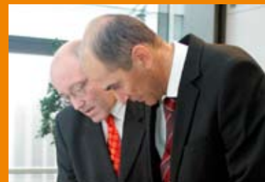
19 octobre 2005: La Chambre de Commerce accueille le Premier Ministre de la Slovénie, S.E. Janez Jansa. 27 participants issus de 23 entreprises slovènes rencontrent 37 hommes d'affaires luxembourgeois représentant 28 entreprises luxembourgeoises