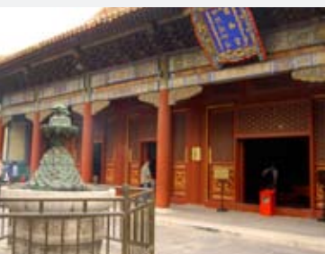
8 - 11 septembre 2005: La Chambre de Commerce participe avec plusieurs entreprises luxembourgeoises à l'exposition ASEM dans le cadre de la « China International Fair for Investment and Trade » (CIFIT) à Xiamen en Chine