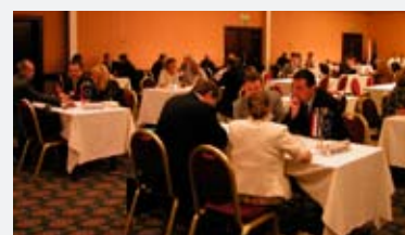
7 - 9 septembre 2005: La délégation commerciale est composée de 26 entreprises luxembourgeoises à la recherche d'opportunités d'affaires en Slovaquie

Pour les présentations plus précises et sur mesure, 48 journées d'opportunités d'affaires (JOA) ont été mises en place, taillées sur mesure des entreprises participantes. Chaque journée, axée sur un pays, a permis aux participants d'obtenir, par le biais de rendez-vous individuels, des informations concrètes sur le marché ciblé. Ces journées ont été réalisées en collaboration avec les attachés économiques et commerciaux belges et ont permis à quelque 200 entreprises d'obtenir des informations précises.