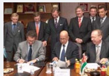
19 - 24 novembre 2005: En Jordanie, dernière étape du voyage, la Chambre de Commerce de Jordanie et la Chambre de Commerce du Luxembourg signent un accord de coopération (Memorandum of Understanding)