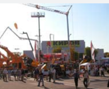
26 septembre - 1 octobre 2005: La « Grande Région » unit ses forces pour assurer une présence remarquable à la Foire Technique Internationale de Plovdiv, en Bulgarie. Avec un stand de plus de 400 m² et 35 exposants, dont 4 sociétés luxembourgeoises, cette première participation est un succès