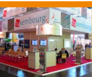
13 - 15 mars 2005: 50 représentants d'entreprises luxembourgeoises participent à la visite au CEBIT à Hanovre et profitent de la bourse de coopération visant à encourager les contacts d'affaires