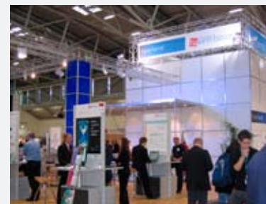
24 - 28 octobre 2005: La Chambre de Commerce organise avec la Zentrale für Produktivität und Technologie e.V. de la Sarre un stand collectif représentant la Grande Région au salon Systems qui s'est déroulé à Munich

Le nouveau Guide du Marché existe en version CD-Rom et sous forme de livre. La consultation peut également se faire en ligne sur le site de la Chambre de Commerce www.cc.lu . Bientôt les entreprises auront la possibilité de mettre à jour leurs données en ligne, ce qui leur permettra de disposer d'une vitrine moderne et actualisée en permanence sur l'extérieur.