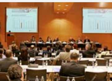
31 mai -1er juin 2005: La Chambre de Commerce accueille une délégation multi-sectorielle d'entreprises bulgares et roumaines. 16 entreprises bulgares et roumaines et 37 entreprises luxembourgeoises participent à une conférence suivie d'une bourse de coopération