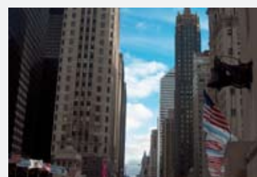
18 - 21 octobre 2005: Vue de Chicago. La mission économique aux Etats-Unis et au Canada a comme objectif de promouvoir le Luxembourg comme site d'investissement