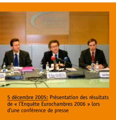
5 décembre 2005: Présentation des résultats de « l'Enquête Eurochambres 2006 » lors d'une conférence de presse

Selon le rapport annuel établi pour l'année 2005-2006 par le World Economic Forum, le Luxembourg se classe au 25 ème rang mondial des économies les plus compétitives, alors qu'il occupait le 26 ème rang mondial dans le classement 2004-2005, la 21 ème place dans le classement 2003-2004 et la 3 ème place dans le classement 2000-2001.