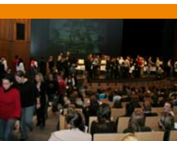
13 novembre 2005: Remise solennelle au Grand Théâtre de la Ville de Luxembourg des CATP (certificat d'aptitude technique et professionnelle) et CITP (certificat d'initiation technique et professionnelle) en l'honneur de 658 lauréats

En 2005, les travaux de la Commission Formation ont porté principalement sur la mise en place de synergies avec d'autres organismes de formation notamment la Chambre de Métiers et l'OLAP, sur l'Université du Luxembourg et la réforme de l'apprentissage.