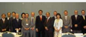
11 - 15 juillet 2005: La Chambre de Commerce signe un accord de coopération avec le Conseil de Développement Commercial Externe de Taïwan (T.A.I.T.R.A) visant à augmenter la coopération économique bilatérale.