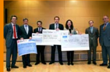
14 novembre 2005: La Chambre de Commerce remet un prix d'encouragement à quatre diplômés de la formation du futur commerçant dispensée par l'IFCC devant une assemblée de près de 200 personnes présentes au Forum Création d'entreprises 2005

La manifestation a eu lieu le 14 novembre 2005 et a, une fois de plus, connu un grand succès avec quelque 150 participants inscrits.