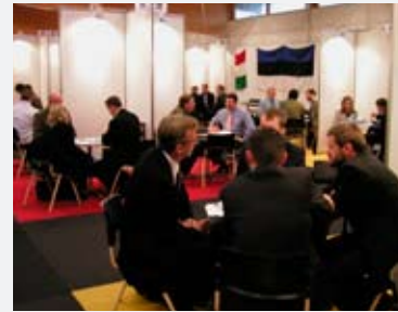
8 – 11 novembre 2005: L'espace B2Fair à Jönköping en Suède accueille plus de 200 entreprises à la bourse de coopération « B2Fair matchmaking »

Montrer que les sociétés et organismes, tant privés que publics, peuvent agir comme de véritables citoyens, conscients de leurs responsabilités face à, entre autre, leur personnel ou l'environnement, tel a été l'enjeu du Symposium «Corporate Social Responsibility» qui s'est déroulé le 1 er mars dernier devant un parterre de 121 participants. Sous la coordination de l'Euro Info Centre, ce symposium s'est déroulé dans le cadre de la campagne européenne de sensibilisation à la responsabilité sociale des entreprises mise en place au Luxembourg par la Chambre de Commerce et la Chambre des Métiers et leurs Euro Infos Centres respectifs, en collaboration avec l'Union des Entreprises Luxembourgeoises et la Caritas.