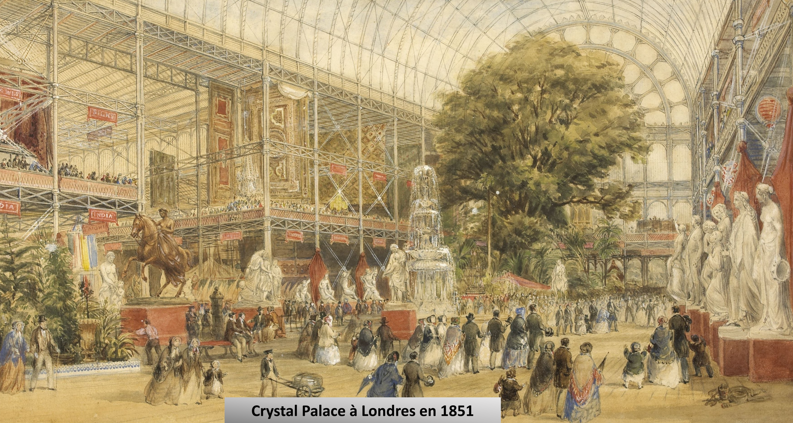
Crystal Palace à Londres en 1851