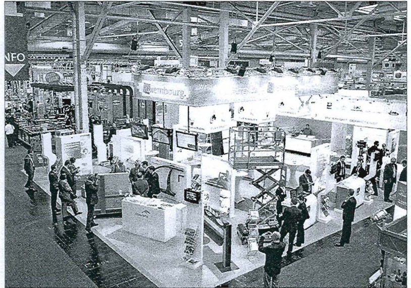
Dix entreprises présentent leurs nouveautés sur le stand commun du Grand-Duché.