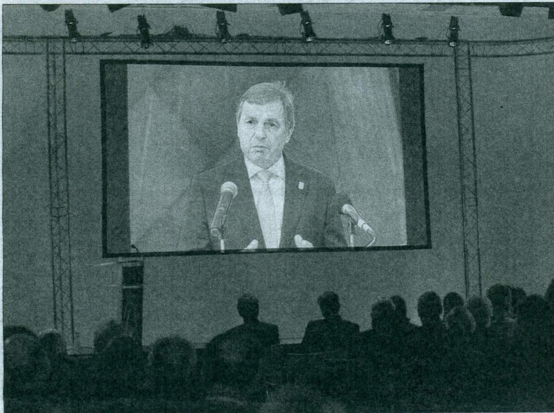
Le discours du ministre de l'Economie, Jeannot Krecké, a été projeté sur grand écran