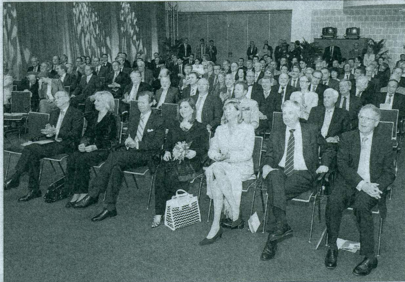
La cérémonie d'ouverture de la Foire de printemps s'est déroulée en présence du couple grand-ducal, de nombreux responsables politiques et syndicaux et de non moins nombreux chefs d'entreprise