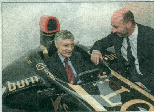
Les deux ministres sur le stand de Wallenborn Transport.

Luxair Cargo, CFL Cargo, CFL Multimodal, Cargolux et la Société de promotion et de développement de l'aéroport de Luxembourg, présents à Munich à côté d'autres sociétés, ont expliqué la plus-value réalisée par leurs entreprises grâce à leur présence sur ce salon. «La présence luxembourgeoise est une première mais ne restera pas unique», a conclu Etienne Schneider. Rendez-vous dans deux ans!