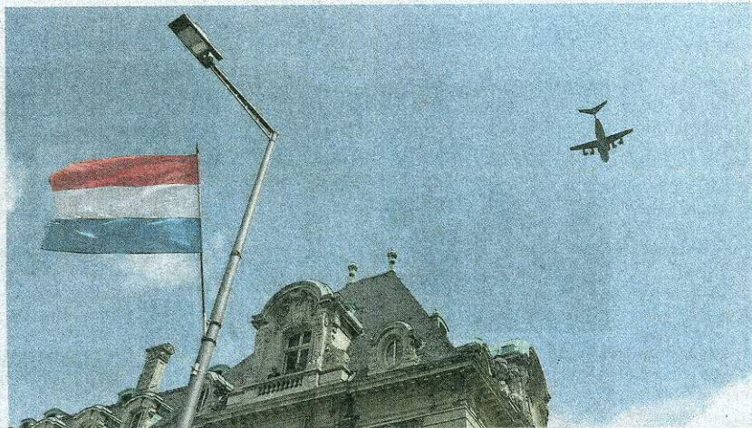
Le rapport souligne l'augmentation du coût de la vie au Luxembourg

Pour l'environnement des affaires, le Luxembourg glisse de quatre rangs en 12ème