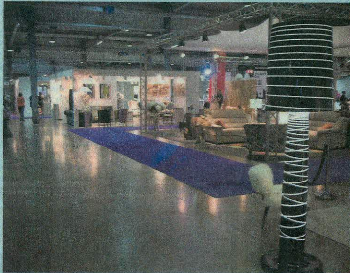
Mit 118 Millionen Euro hat die Messe „Home & Living 2017“ laut der Studie den größten wirtschaftlichen Einfluss

Auf diese Zahlen kam Quest durch die telefonische Befragung von 283 Ausstellern und 1.235 Besuchern in verschiedenen Zeitabständen sowie dutzenden von Modellrechnungen. Die Messen „Home&Living Expo 2017“, „Top Kids 2017“ und „Vakanz