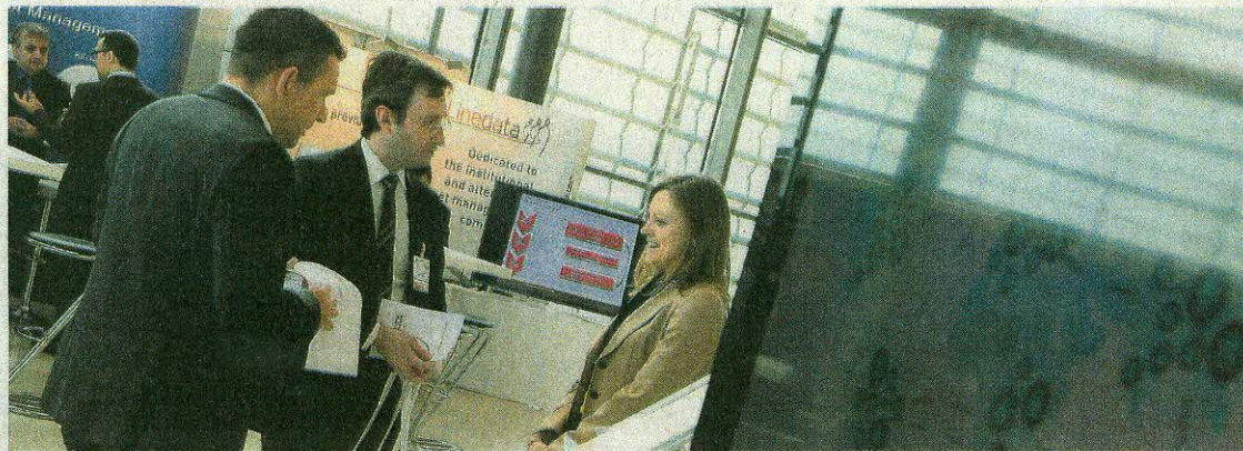
Le Luxembourg se distingue surtout sur le front de l'environnement des affaires avec un bond de dix places

Là où le Luxembourg se démarque, c'est sur le front de l'environnement des affaires avec un bond de dix places, au quatrième rang. C'est simple, il figure parmi les meilleu-