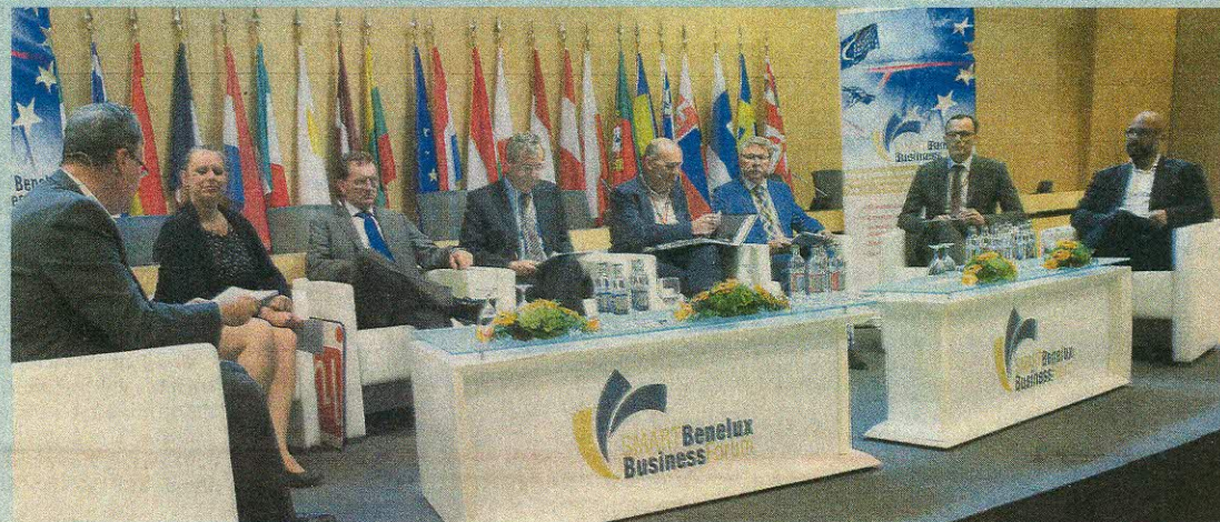
La table ronde a ouvert deux journées dédiées aux relations d'affaires dans les pays du Benelux où le sujet de l'économie circulaire est largement mis en avant