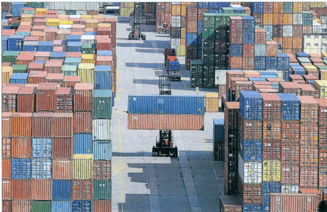
Malgré la crise économique qui touche durement le secteur logistique, les perspectives à long terme restent très favorables.

Le tunnel de base du Gotthard en est une parfaite illustration: tandis que les Suisses creusent le tunnel et investissent l'équivalent de plus de 20 milliards d'euros