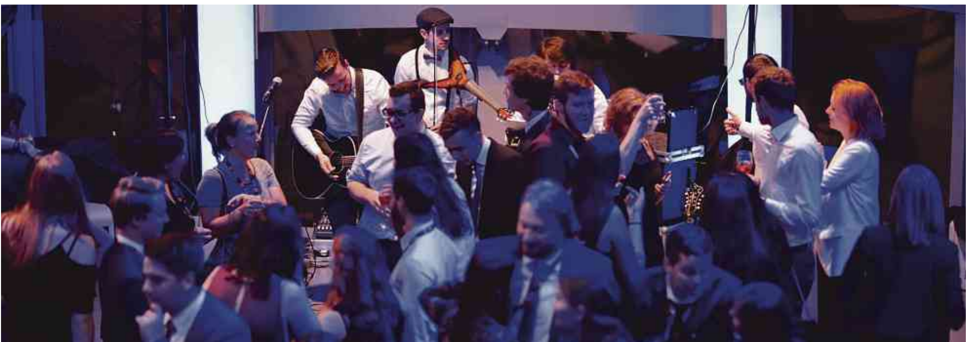
Zero Point Five – Atomium

An deem Sënn: Op vill weider REEL'en! Vive d'Studenten!