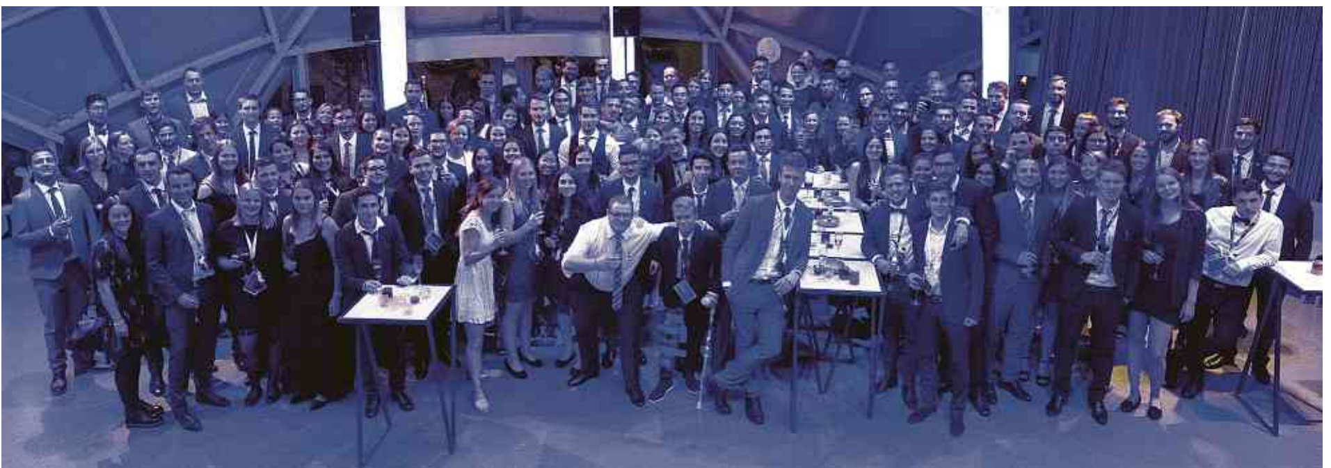
Gruppenfoto vun den Participanten

No enger relativ kuerzer Nuecht ass et Freides Moies direkt viru gaange mat flotte Visitten zu Bréissel. Zu Auswahl stoungen: Chocolate Village, Europäesch Parlament, Train World, Musée des égouts an een Trip op Antwerpen. Weider ass et du mam Mëttegiessen am Restaurant „Chez Léon“, wou et ee gudde Maufel ze iesse gouf. Mëttes stoungen d'Partnervirträg um Programm. Och dëst Joer konnte vill Partner fonnt ginn, déi d'REEL ënnerstëtzt hunn an d'Geleeënheet genotzt hunn, fir hire Betrib de Studente méi nozebréngen. No de Presentatiounen war de Studenten dunn och d'Méiglechkeet ginn, op enger