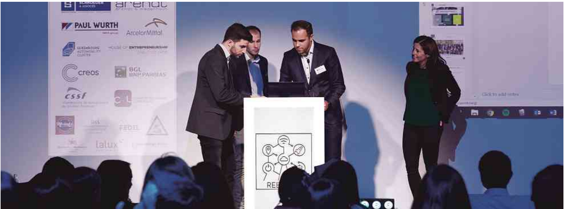
Soirée chic am Atomium