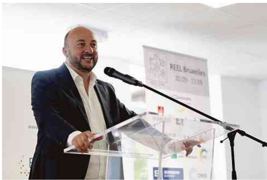
Monologue vum Vizepremier an Wirtschaftsminister Etienne Schneider

Fir déi 34. Kéier hunn sech eng Ronn 120 Studenten op de Wee gemaach, fir un der REEL deelzehuelen. Bréissel ass bekannt dofir, dass vill Lëtzebuerger Studenten hier Etüden do maachen, dofir huet den Comité vun der REEL et sech net huele gelooss eng flott REEL zu Bréissel ze organiséieren. No ville Méint Preparatioun ass et en