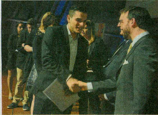
Erbgroßherzog Guillaume und Arbeitsminister Nicolas Schmit überreichten die Zertifikate „Promotion du travail“