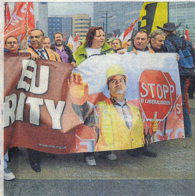
économique mondial, Klaus Schwab, invite les pays à engager les réformes