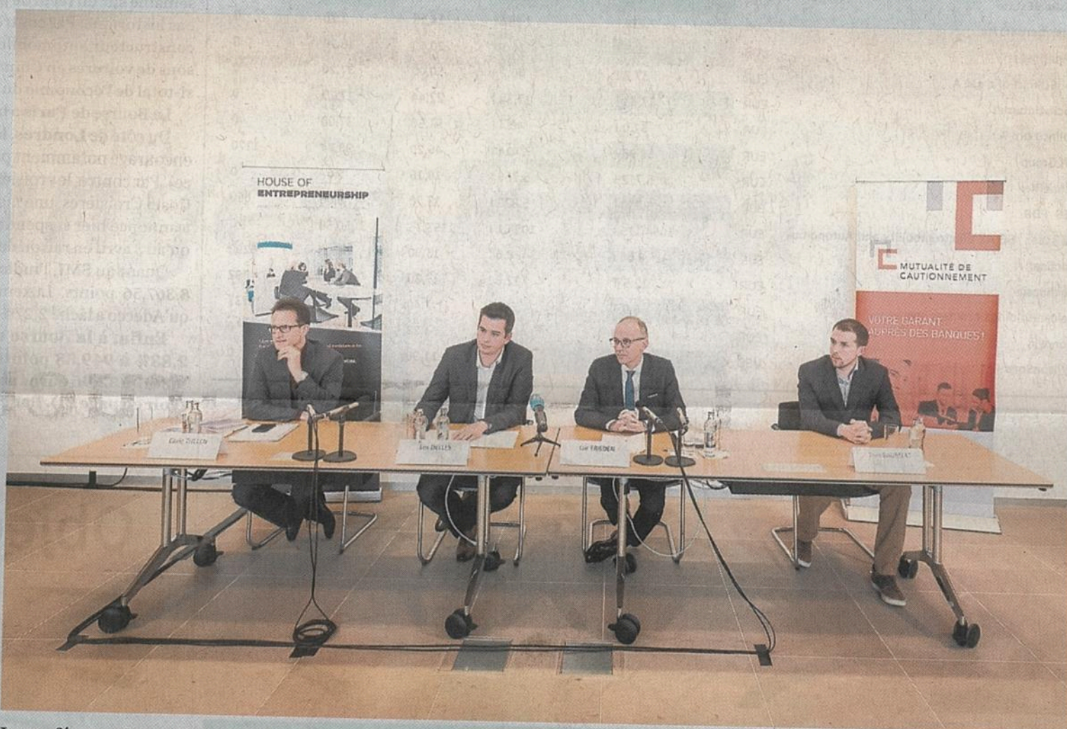
La conférence de presse s'est organisée à distance respectable et également par visioconférence

Ce nouveau service d'assistance téléphonique n'a pas pour but de répondre à des questions sanitaires, qui sont, elles, prises en charge par le ministère de la Santé. Luc Frieden a assuré que les banques «joueraient le jeu. Les entreprises sont leurs clients et elles apprécient ces garanties qui vont leur permettre d'accorder plus facilement des crédits».