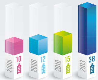
Nombre de sociétés