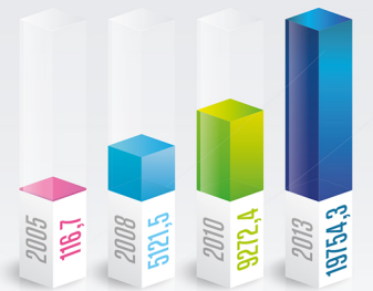
Chiffre d'affaires (en million €)